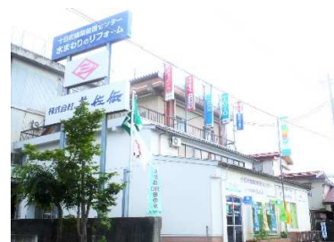
美佐伝 四日町ショールーム